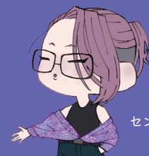
センターマスコット まみちゃん

支援者等に対して、芸術上価値の高い作品等の適切な記録、保存方法、販売等の支援、及び所有権、著作権その他の権利の保護等について研修等を行うよ。